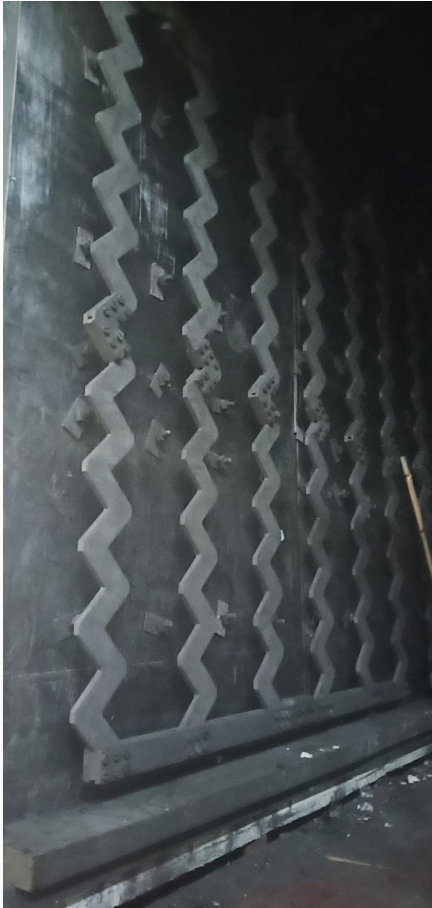
株洲远航工业炉科技有限公司 - 碳化硅/氮化硅真空高温烧结炉设备实物图

碳化硅/氮化硅真空高温烧结炉适用于碳化硅、氮化硅及超高温陶瓷材料的烧结研究与小批量试制，可按不同材料体系配置真空和气氛条件。