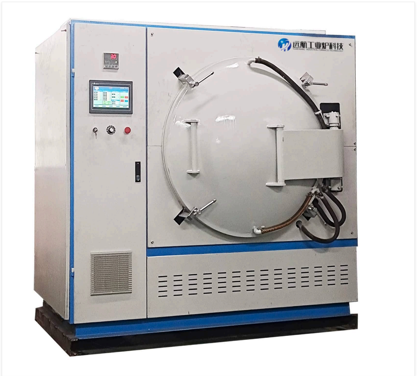
图：远航工业炉-小型气氛真空箱式炉（实验室/小批量专用）