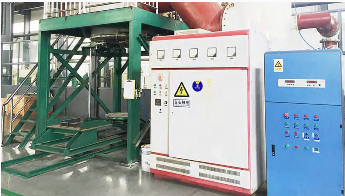
株洲远航工业炉科技有限公司 - 小型气氛真空箱式炉设备实物图

多能合一： 集成气氛保护与真空功能，采用AI自学习PID温控曲线拟合技术，确保全量程（室温至 2300°C）温控高度精确。