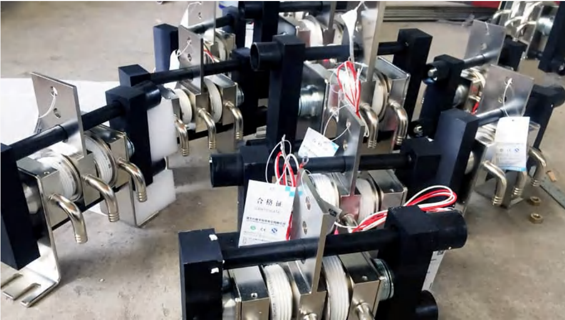
株洲远航工业炉科技有限公司 - 可控硅水冷硅套散热器设备实物图

中频炉的中频电源在设计中，对于晶闸管可控硅来说，必须使用水冷散热器。株洲远航工业炉科技有限公司常用的为SS系列水冷可控硅散热器。SS系列水冷可控硅散热器，第一个S表示散热器，第二个S表示水冷，是用水作为冷却介质，通过水循环来达到使可控硅等元件散热的效果。以下为远航工业炉对可控硅水冷套配套选型的简要介绍，可控硅水冷套也就是水冷散热器的配套选型标准。